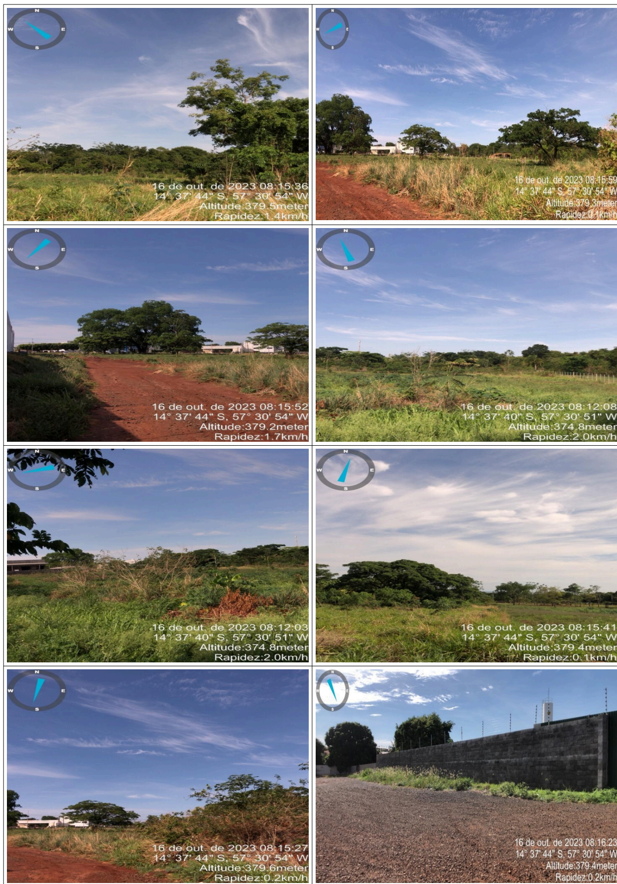
Figuras 05 a 11 - Vistas da área ocupada pelo Parque

Assinado por 2 pessoas: VANESSA FERREIRO DE ANDRADE @VANESSA.FERREIRO@TANGARADASERRA.MT e informo o código D3168-8868-6888 E-EB82 Para verificar a validade das assinaturas, acesse https://tangaradaserra.1doc.com.br/verificacao/D3168-8868-6888 E-EB82